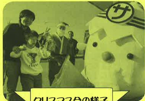
クリスマス会の様子

イオンモール東員のサンタさんがバラエティーに 富んだクリスマススイーツをくださいました。く じ引きで順番を決めて、好きなお菓子を選べて、 みんなとても楽しんでいました。