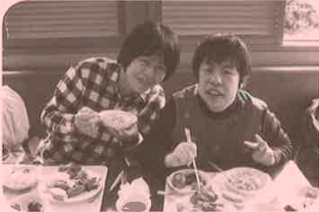
ハイキングを食へて、おいしいかったです、 げろおんせんにはいって、 きもちよかったです。