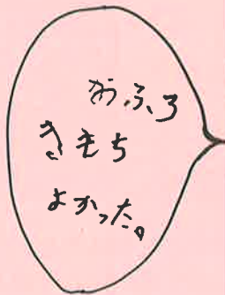
おんせんに いって きもち よかったです。