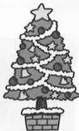
桑名ゴスペルクワイアコンサート