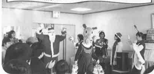
ハンドベルクワイア with Kコンサート

ADEKA様・イオン東員店様・松下電気保安管理事務所様 よりケーキやお菓子のプレゼント